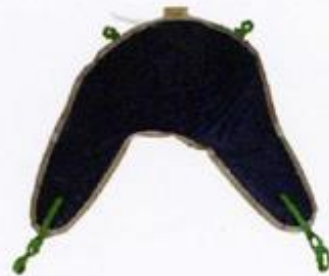
Cintura standard con appoggiatesta