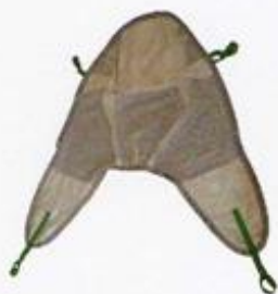
Cintura perforata per bagno con appoggiatesta

I prodotti KRÄMER sono omologati ISO 9001 e rispondono alle più recenti normative europee. Le versioni elettriche sono marchiati CE come prevede la nuova legislazione, Direttiva 93/42 CEE per Dispositivi Medici