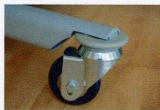
Ruote anteriori con paracolpi