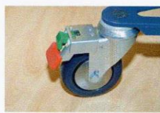
Ruote posteriori bloccabili

I prodotti KRÄMER sono omologati ISO 9001 e rispondono alle più recenti normative europee. Le versioni elettriche sono marchiati CE come prevede la nuova legislazione, Direttiva 93/42 CEE per Dispositivi Medici