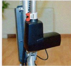
Leva abbassamento d'emergenza