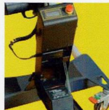
Kit batteria Krämer con display rilevazione movimenti