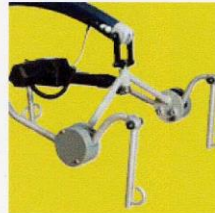
Bilancino basculante con movimento elettrico