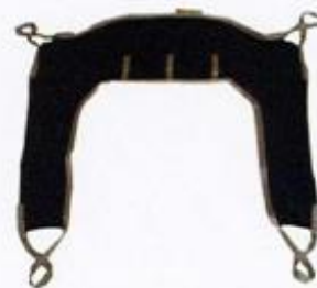
Cintura WC con nastro di sicurezza

Tutte le cinture sono disponibili nelle misure S - M - L - XL - XXL