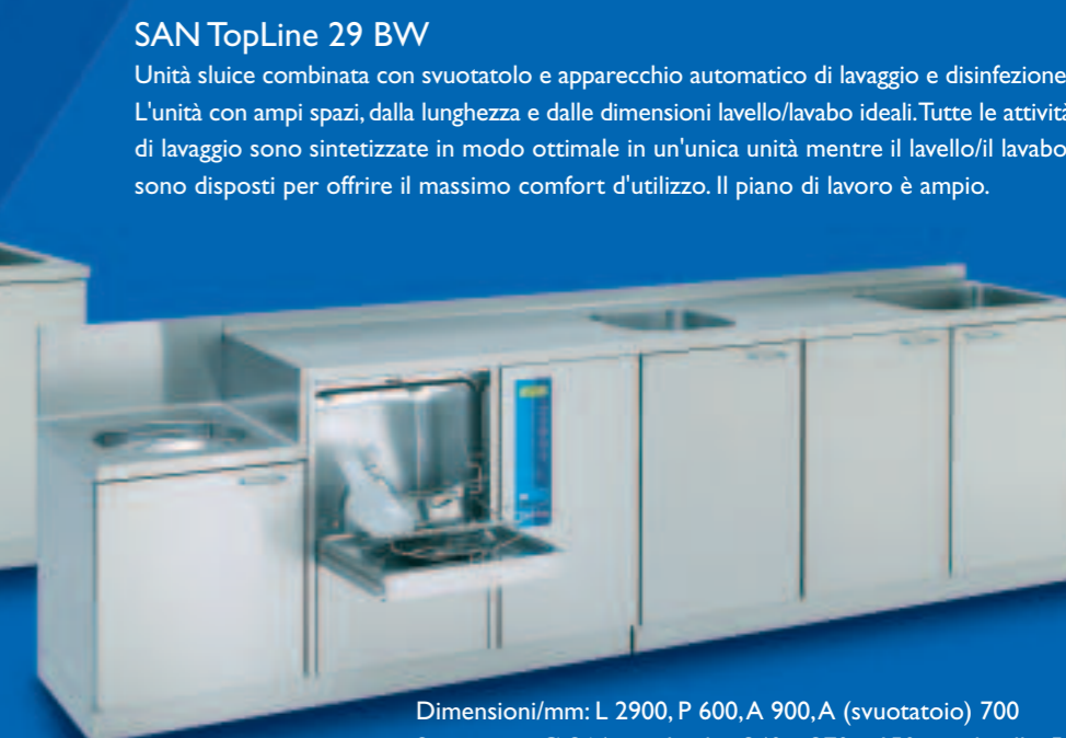
SAN TopLine 29 BW

Dimensioni/mm: L 2400, P 600, A 900, A (svuotatoio) 700, svuotatoio: Ø 364 mm, lavello: 500 x 400 x 300 mm, armadio: 1000 mm