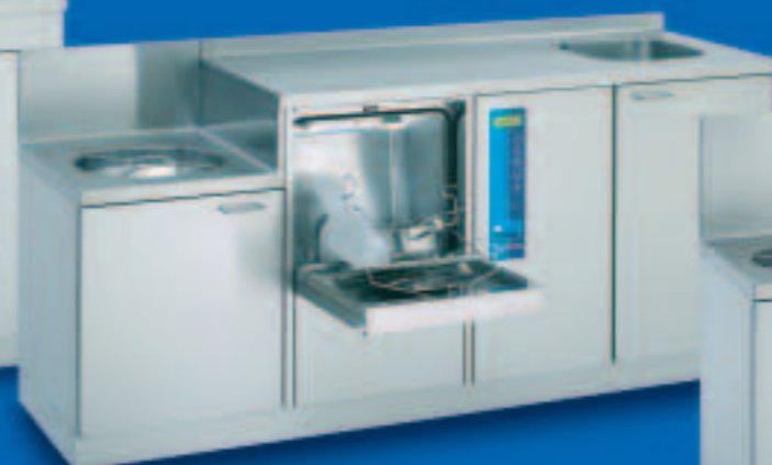
SAN TopLine 19 B

Unità sluce combinata con svuotatoio, lavabo e apparecchio automatico di lavaggio e disinfezione. La combinazione compatta per le necessità delle camere di lavoro non sterili. Dimensioni/mm: L 1400, P 600, A 1000, A (svuotatoio) 700, svuotatoio: Ø 364 mm, lavabo: 340 x 370 x 150 mm