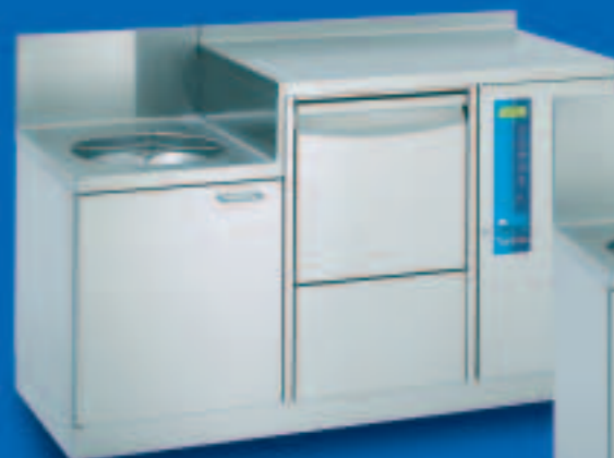
SAN TopLine 14

Unità sluce combinata con svuotatoio, apparecchio automatico di lavaggio e disinfezione, a caricamento frontale con piano di lavoro e di appoggio. Dimensioni/mm: L 1400, P 600, A 900, A (svuotatoio) 700 Svuotatoio: Ø 364 mm