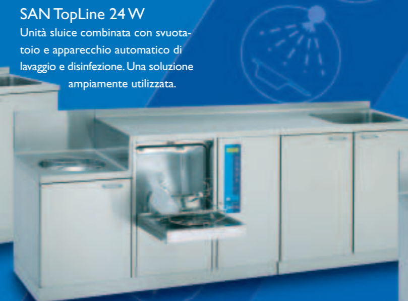
SAN TopLine 24 W

d'ingombro ridotto. Con svuotatoio, piano di appoggio, lavabo, lavello e un capiente armadio. Dimensioni/mm: L 2000, P 600, A 1000, A (svuotatoio) 700, svuotatoio: Ø 364 mm, lavabo: 340 x 370 x 150 mm, lavello: 500 x 400 x 300 mm, armadio: 600 mm