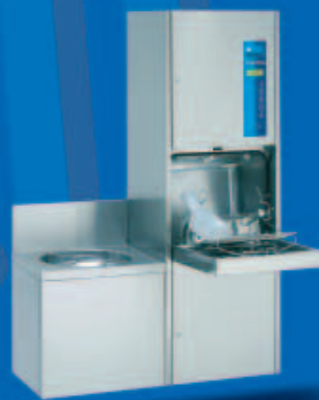
TopLine 10 A

Apparecchio automatico di lavaggio e disinfezione per il montaggio a pavimento con base. Basta posizionarlo e allacciarlo. Rappresenta quindi la soluzione ideale per utilizzare gli allacciamenti già presenti. Dimensioni/mm: L 500, P 450 o 600, A (apparecchio) 1730