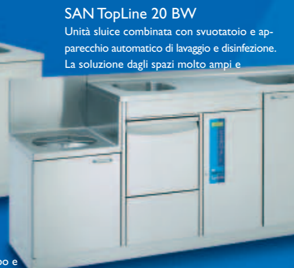
SAN TopLine 20 BW

Unità sluce combinata con svuotatoio, lavabo e apparecchio automatico di lavaggio e disinfezione. Combinazione con ampio piano di appoggio e spazio supplementare nell'armadio. Dimensioni/mm: L 1900, P 600, A 900, A (svuotatoio) 700, svuotatoio: Ø 364 mm, lavabo: 340 x 370 x 150 mm, armadio: 500 mm