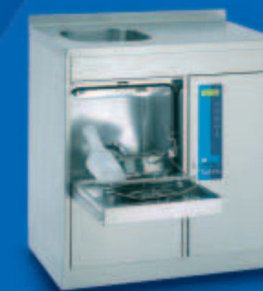
TopLine 40 B

Apparecchio automatico di lavaggio e disinfezione come un modello ad armadio, da incasso sotto un piano di lavoro. L'integrazione ideale per un'unità ad armadio già esistente. Il singolo apparecchio presenta un ampio piano di lavoro e di appoggio chiuso. Dimensioni/mm: L 900, P 600, A 900