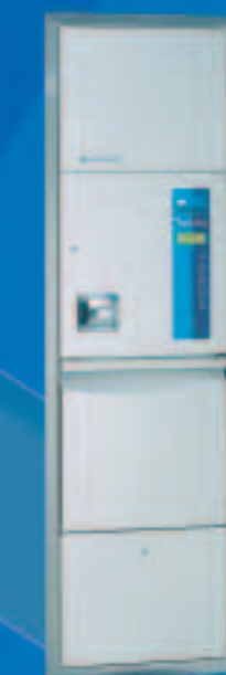
TopLine 30 WWC

Apparecchio automatico di lavaggio e disinfezione per il montaggio a parete a filo; telaio di montaggio in dotazione. Il modello adatto per il bagno di una stanza d'ospedale. Dimensioni telaio di base/mm: L 650, P 450, A 2210 Frontale visibile: L 530, A 1760