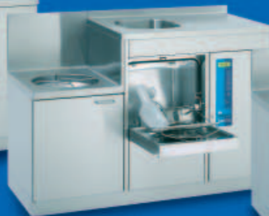
SAN TopLine 14 B

Unità sluce combinata con svuotatoio, apparecchio automatico di lavaggio e disinfezione, a caricamento frontale con piano di lavoro e di appoggio. Dimensioni/mm: L 1400, P 600, A 900, A (svuotatoio) 700 Svuotatoio: Ø 364 mm