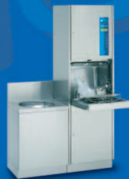
TopLine 20 A

Apparecchio automatico di lavaggio e disinfezione con svuotatoio; montaggio a parete che lascia libero il pavimento. La soluzione di lavoro combinata mirata e compatta per il smaltitoio. Dimensioni/mm: L 1000, P 450 o 600, A (apparecchio) 1630