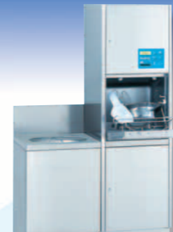
TOPIC 20.2 A

Apparecchiatura combinata per il lavaggio e la disinfezione versione completa di vuotatoio inox con montaggio a parete. La soluzione di lavoro combinata pensata per garantire l'igiene e per facilitare l'assistenza. Dimensioni/mm: L 1.000, P 450 o 600, A (macchina) 1,510