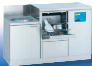
SAN 14 / TOPIC 40.2

Apparecchiatura per il lavaggio e la disinfezione versione con montaggio a pavimento su zoccolo inox. E' sufficiente posizionarla ed allacciarla. Rappresenta quindi la soluzione ideale per utilizzare gli impianti già presenti. Dimensioni/mm: L 500, P 450 o 600, A (macchina) 1,610