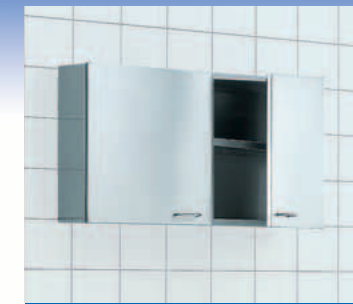
Pensili con anta

Basi a giorno con un ripiano. 500, 1.000 e 1.200 mm