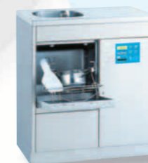
TOPIC 40.2 B

Apparecchiatura per il lavaggio e la disinfezione versione sotto il piano di lavoro. Rappresenta il completamento ideale per unità con base ad ante già esistenti. La dotazione viene completata da un ampio piano di lavoro e di appoggio con bordo di contenimento. Dimensioni/mm: L 900, P 600, A 900