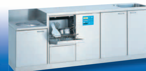
SAN 24 W / TOPIC 40.2

Apparecchiatura combinata per il lavaggio e la disinfezione versione sotto il piano di lavoro completa di piano di lavoro e di appoggio con bordo di contenimento, base ad ante, vuotatoio e lavabo inox integrato. La soluzione ideale e più utilizzata per avere piani di lavoro molto ampi in un ingombro ridotto. Dimensioni/mm: L 2.400, P 600, A 900, A (vuotatoio) 700 Lavabo: 500 x 400 x 300 mm, Armadio con 2 ante: 1.000 mm.