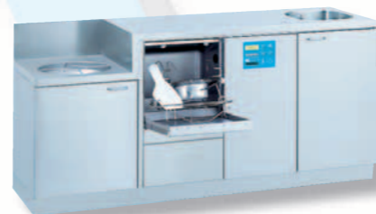
SAN 19 B / TOPIC 40.2

Apparecchiatura per il lavaggio e la disinfezione versione sotto il piano di lavoro. La dotazione viene completata da un ampio piano di lavoro e di appoggio con bordo di contenimento e lavabo inox integrato. L 900, P 600, A (macchina) 1.000 Lavabo: 340 x 370 x 150 mm