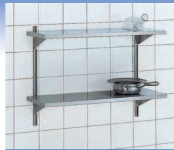
Mensola a parete

Mensola con ripiani regolabili in altezza e disponibili in tutte le lunghezze adeguate. Profondità 350 mm.