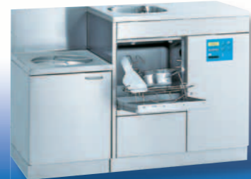
SAN 14 B / TOPIC 40.2

Apparecchiatura combinata per il lavaggio e disinfezione ad apertura frontale completa di vuotatoio, piano di lavoro e di appoggio con bordo di contenimento Dimensioni mm: L 1.400, P 600, A 900, A (vuotatoio) 700