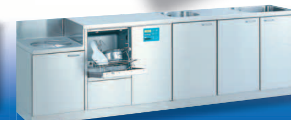
SAN 29 BW / TOPIC 40.2

Apparecchiatura combinata per il lavaggio e la disinfezione versione sotto il piano di lavoro completa di piano di lavoro e di appoggio con bordo di contenimento, base ad ante, vuotatoio e lavabo inox integrato. La soluzione ideale e più utilizzata per avere piani di lavoro molto ampi in un ingombro ridotto. Dimensioni/mm: L 2.400, P 600, A 900, A (vuotatoio) 700 Lavabo: 500 x 400 x 300 mm, Armadio con 2 ante: 1.000 mm.