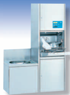
TOPIC 10.2 A

L'apparecchiatura adatta ad ogni settore dell'assistenza sanitaria.