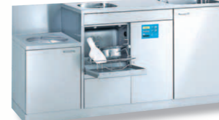
SAN 20 BW / TOPIC 40.2

Apparecchiatura combinata per il lavaggio e la disinfezione versione sotto il piano di lavoro completa di piano di lavoro e di appoggio con bordo di contenimento, base ad ante, vuotatoio e lavabo inox integrato e spazio supplementare nell'armadio Dimensioni/mm: L 1.900, P 600, A 900, A (vuotatoio) 700 Lavabo: 340 x 370 x 150 mm, Armadio con ante: 500mm.