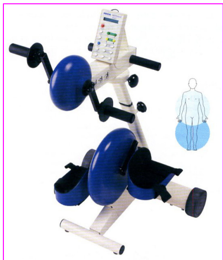
VIVAméd complet COD. PRO-C-07473

E' un cicloergometro adatto al training sia degli arti inferiori che superiori avente tutte le possibilità terapeutiche e caratteristiche dei modelli standard e classic. In particolare è possibile ruotare in autonomia il trainer per arti superiori per un cambio di allenamento agli arti inferiori. Si possono applicare diversi accessori a seconda della diversa funzionalità di presa posseduta.